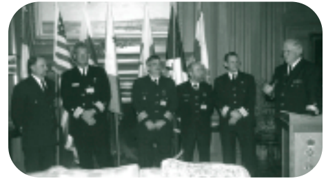
Les membres du Conseil national sont présentés lors de la cérémonie de remise des prix à l'occasion du 25 e anniversaire de la GCAC.

Un rassemblement informel a eu lieu vendredi soir pour permettre aux personnes de différents grades et aux invités d'honneur de socialiser sans se soucier des contraintes du protocole. Le groupe de Rochester, Jon Seiger and the All-Stars, qui avait effectué une performance à un gala la semaine précédente pour la sénatrice de New York, Hillary Clinton, a assuré le divertissement au cours de la soirée. Le