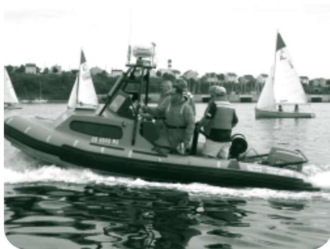
Vers la scène : une équipe d'auxiliaires au cours de la compétition SAR régionale de la GCAC Maritimes.