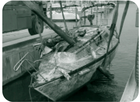
Un navire après le passage de Isabel

« Les plaisanciers qui ont profité du long délai avant l'arrivée de l'ouragan Isabel et qui ont fait des préparatifs en prévision de son arrivée en enlevant leur bateau, en ajoutant du cordage supplémentaire, des tabliers protecteurs, en réduisant l'exposition au vent ou en ancrant