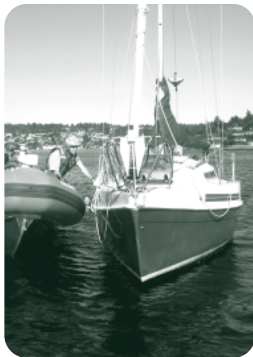
Épreuve SAREX lors de la compétition SAR régionale de la GCAC Pacifique à Nanaimo.