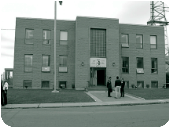
Nouvelle Administration centrale de la GCAC Québec à Sorel.

fête ses 25 ans en acquérant pignon sur rue.