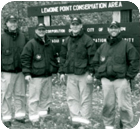
Gagnants de la médaille de bronze lors des jeux de SARSCÈNE.

SARSCÈNE, le plus grand congrès de recherche et sauvetage au Canada, s'est déroulé à Kingston, du 13 au 18 octobre 2003.