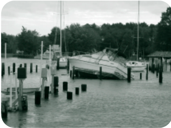
Navire endommagé par l'ouragan Isabel

La Boat Owners Association of the United States indique que les pertes aux embarcations de plaisance causées par l'ouragan Isabel (ce qui exclut les marinas, les autres infrastructures ou les navires commerciaux) totaliseront plus de 150 millions $. La plupart des dommages ont eu lieu dans le cours supérieur des bassins hydrographiques de la baie Chesapeake et de la rivière Potomac, loin de l'endroit où a débuté la tempête en Caroline du Nord.