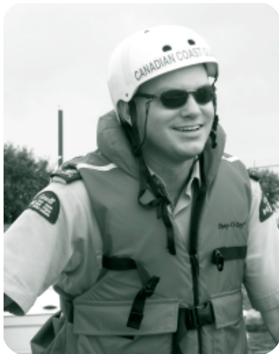
Les bénévoles de la GCAC C&A ont apprécié la compétition SAR régionale tenue à Kingston.