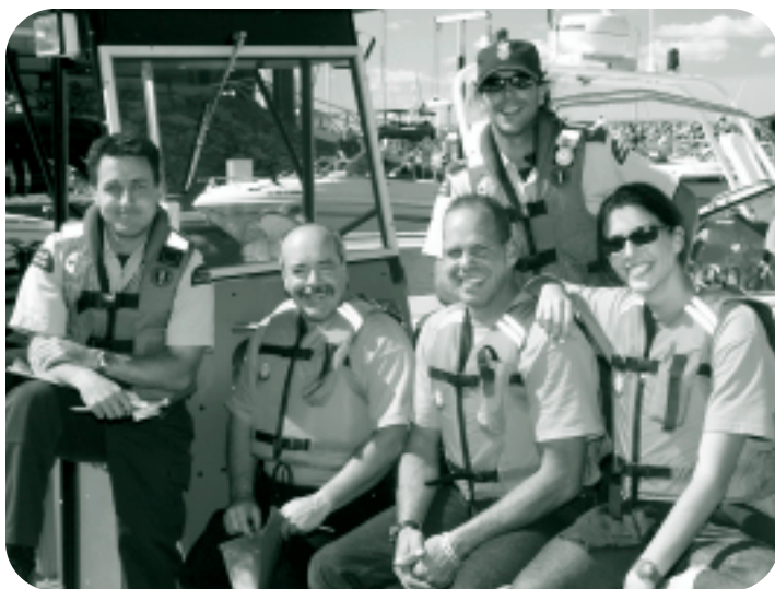
À Sorel, des auxiliaires et des employés de la GCC s'amuse lors d'une compétition SAR régionale.