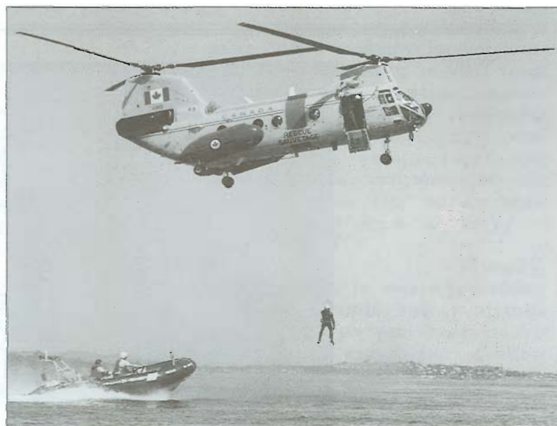
Exercice conjointe avec l'Escadrille 442, Commo C.-B. et l'Auxiliaire 35 à la commande d'une vedette de la Garde côtière à Vancouver